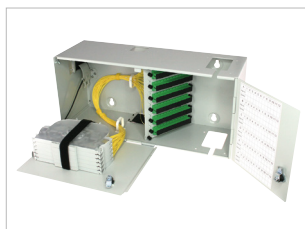
POINT DE RACCORDEMENT IMMEUBLE 48 OU 72 FIBRES