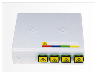
DTIO 4 FIBRES OPTIQUES