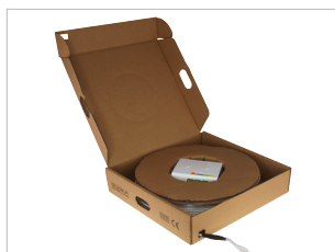
CABLE DROP PRE-CONNECTORISE SC/APC + DTIO